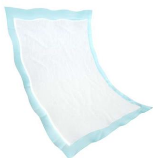
Alèse Abri-Soft Ultra light 40x60 cm Réf: 1000017876

Abena-Frantex SA 5 rue Thomas Edison 60180 Nogent-sur-Oise